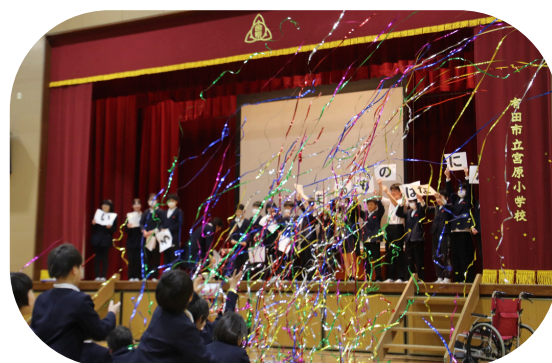
ミッション達成の瞬間です！