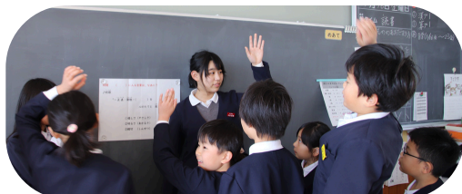
グループのみんなに、答えの多数決をとる6年生

当日は、217名が20のグループに分かれ、クイズ&チャレンジラリーを行いました。クイズを解いたり、様々なチャレンジしたりと、みんな楽しそうでした。6年生も「最高の思い出ができました」「200年、300年続くようにしたいです」と感想を伝えてくれました。皆様方のおかげで、大成功に終わりました。ご協力いただきありがとうございました。